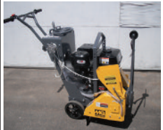
MULTIQUIP, scie à asphalte et béton, neuves et usagées À PARTIR DE $ 2,300.00