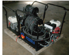
Pompe à colasse avec réservoir nettoyage, Aussi machine à bordure