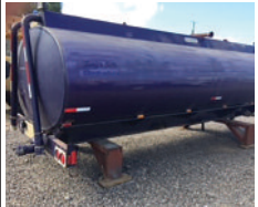
Réservoir à eau, cap. 16,000 lt., longueur 20', PTO, pompe, etc. $ 5,500.00

Outillage d'asphalte, • Rateaux • Raquettes, • Foulons, Etc.