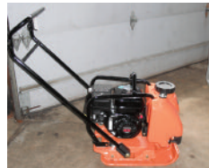
MIKASA plaques vibrantes plusieurs modèles À PARTIR DE $ 1,730.00