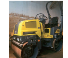
Dynapac CC900, neuf, 36", diesel