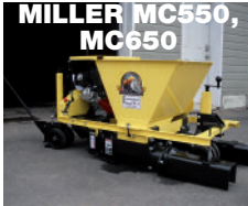
MILLER MC550, MC650 Machine à bordure, gaz ou diesel