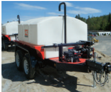
MULTIQUIP, remorque à eau, moteur Honda, 500 gallons, 158 gpm, freins hydr., barre d'arrosage