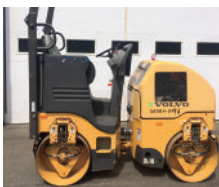
2011 VOLVO DD16, 341 heures, 39", diesel, $ 22,000.00