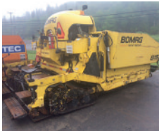
2005 BOMAG 815RT, 355 heures, table 8 à 15' $ 32,000.00