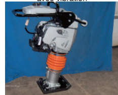
MIKASA pilonneuse, plusieurs modèles