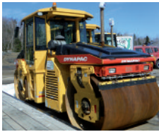
2004 Dynapac CC422HF, largeur 66", cabine, air, lumières $ 29,900.00