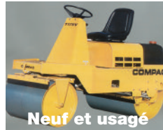
Neuf et usagé COMPAC T175V, Honda 20 hp, largeur 38", 3 000 lb, avec vibration