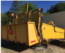
Boîte isolée pour asphalte