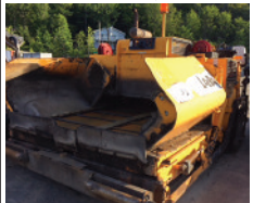
2008 LEEBOY 8515T, table 8' à 15'