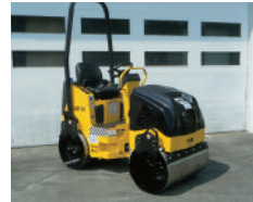
MQ AR14H, moteur Honda GX630, largeur 36", 2,690 lb, avec vibration