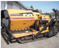
MAULDIN 1750C, Plusieurs en inventaire